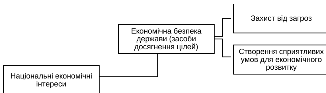
Рис. 1. Ієрархічна структура взаємозв'язку між національними економічними інтересами та економічною безпекою держави

Місія Бюро економічної безпеки полягає у забезпеченні безпекового напрямку для економіки